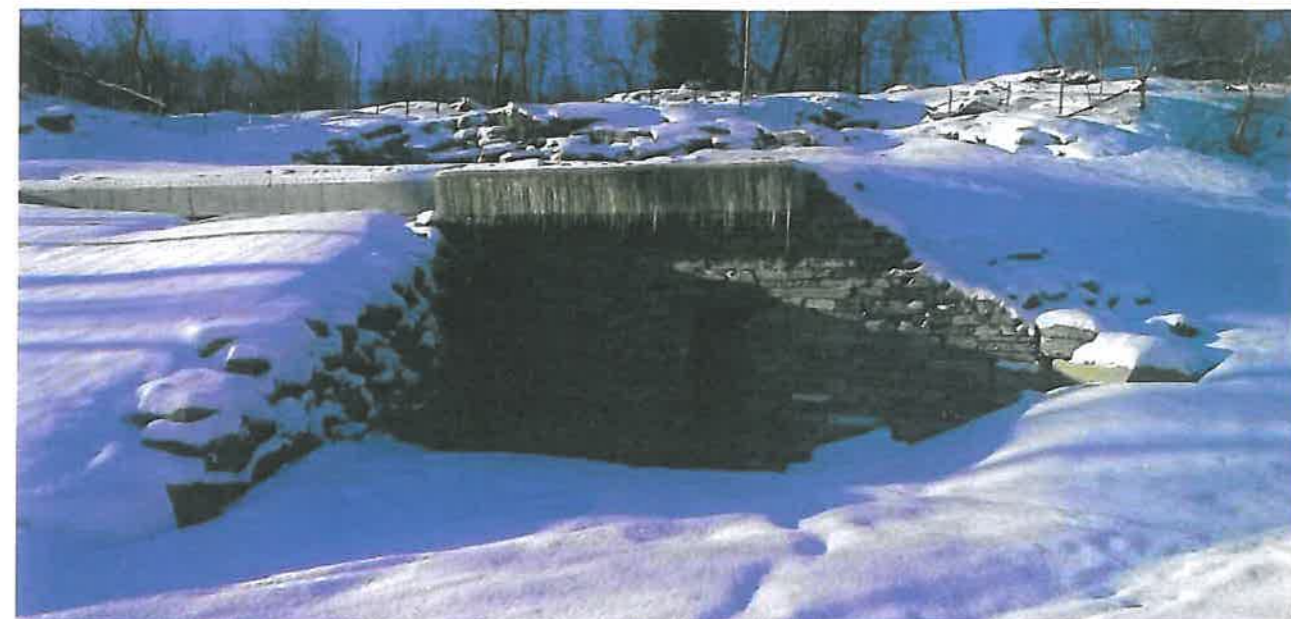
Inngang til nytt høgdebasseng.

§ 14. Vannkilde og vannbehandling Eier av vannforsyningssystem skal påse at det planlegges og gjennomføres nødvendig beskyttelse av vannkilden(e) for å forhindre fare for forurensning av drikkevannet, og om nødvendig erverve rettigheter for å oppretthalde slik beskyttelse.