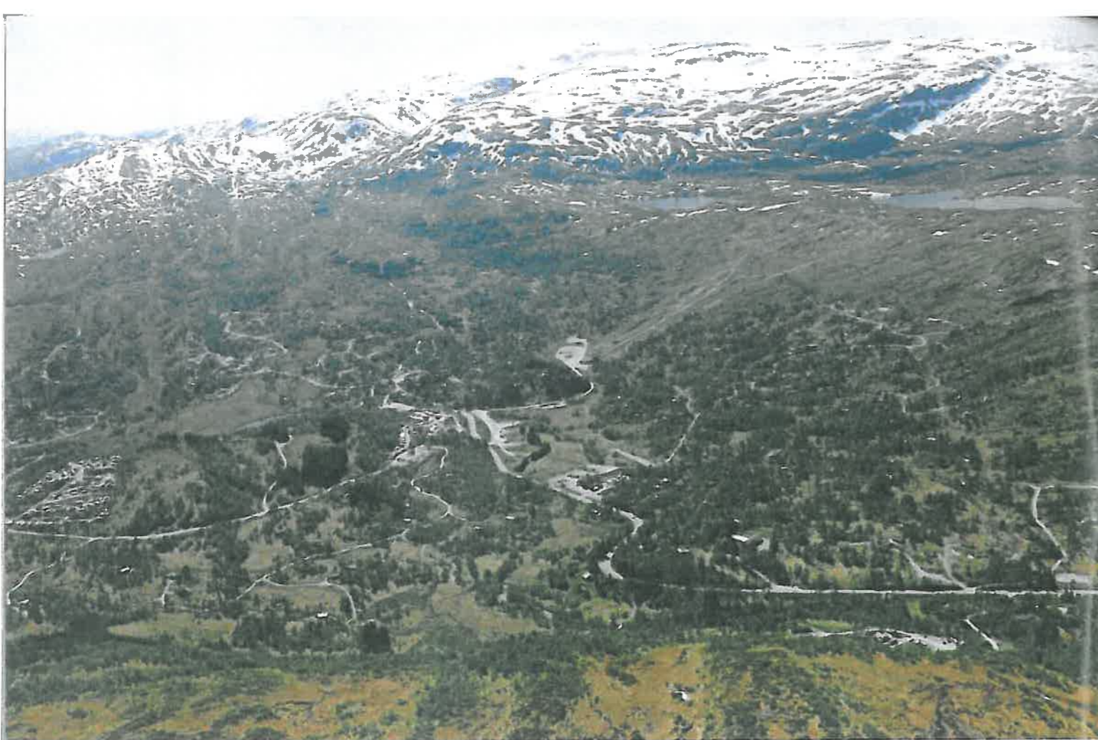
Kvamskogen hytte og rekreasjonsområde.