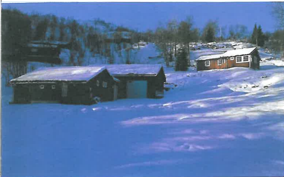
Bygg for gammalt vassverk til venstre, mellombygg og nybygg.