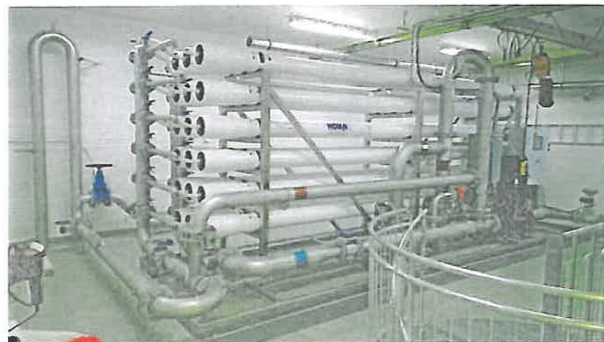
Membranfilter i 1. etasje.

Kvamskogen «nye» vassverk vart sett i drift 24. oktober 2013. Anlegget har så langt fungert etter planen. Det har vore tett oppfølging av vasskvaliteten sidan opstarten. I ein kort periode observerte ein høgt kimtal, medan andre parametre som koliforme, e-coli, farge og turbiditet har vore godt innfor krava i drikkevassforskrifta.